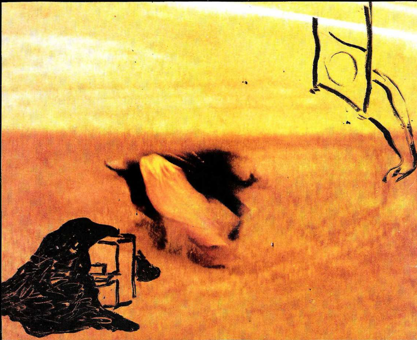
Installation « L'Aréna » - 1989