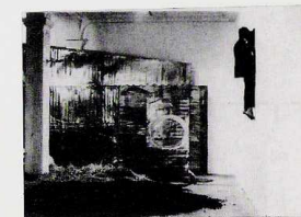
El destí és un atzar MUN FIGUERAS