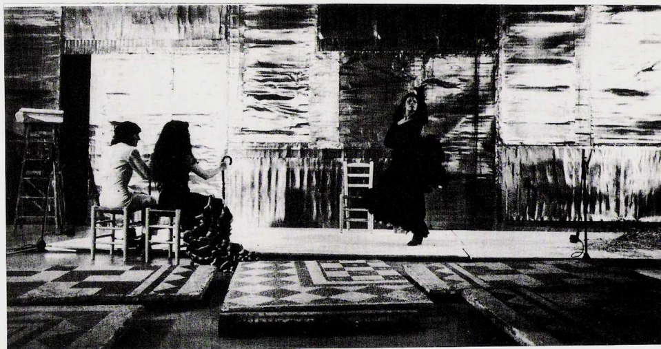
□ Murmuris del bosc - Flux 2. (1986)