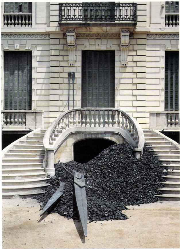
"Capvespre a Potsdam", 1992 Carbó i plom